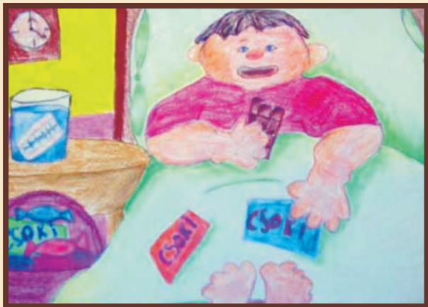
Rajzolta: Martin Martina Ramóna

Ha interneten vásárolsz, főszabályként 8 munkanapon belül meggondolhatod magad, és visszaküldheted a terméket.